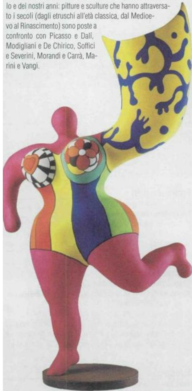
Niki de saint Phalle, «Ange lumineuse», al Castello Aldobrandesco di Arcidosso (GR) fino al 19 agosto 2009 e poi alla Fortezza Orsini di Sorano (22 agosto-27 settembre )

Una selezione di circa 130 opere indaga la varietà dei rapporti intercorsi nei secoli tra l'arte dell'antichità e quella del XX secolo e dei nostri anni: pitture e sculture che hanno attraversato i secoli (dagli etruschi all'età classica, dal Medioevo al Rinascimento) sono poste a confronto con Picasso e Dalí, Modigliani e De Chirico, Soffici e Severini, Morandi e Carrà, Marini e Vangi.